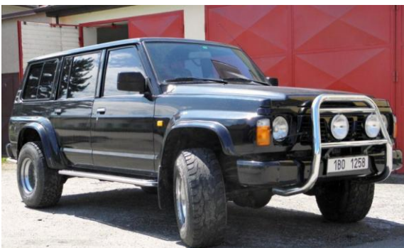
Nissan Patrol GR wagon

Dále obec žádala o dotaci na úroky z úvěrů ve výši 27.000,- Kč – výsledek dotačního řízení zatím neznáme.