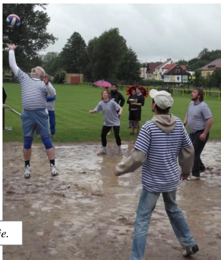
Foto z 1. ročníku volejbalového turnaje.

Markland o.s. oznamuje svým příznivcům a občanům Skalice nad Svitavou letošní otevření areálu Markland od 1. července. Po celé prázdniny vstup do areálu zdarma, přijďte si zasportovat – možnost využití volejbalového hřiště, pingpongového stolu, relaxovat – stylová hospůdka, ohniště, posezení pro rodiče i děti, atd.