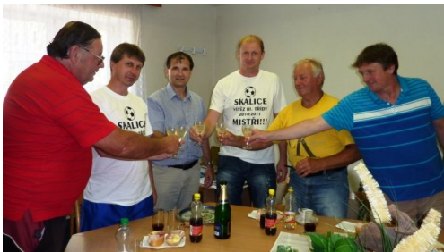
K postupu do okresního přeboru blahopřál fotbalistům starosta obce.